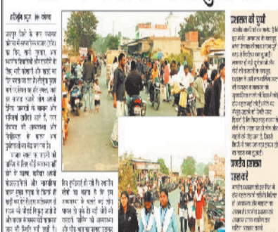
प्रशासन को बड़े हादसे का डंजान, रोज़ तो रही दुर्घटना